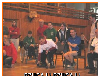
RZUCAJ I RZUCAJ I

Już trzeci raz nasz warsztat przygotował wojewódzkie zawody sportowe w Boccie, na hali sportowej w przy ulicy Kościuszki. W tym roku udział wzięło 12 ekip. Przed rozpoczęciem zawodów swoją twórczość zaprezentował zespół „Szwagry”. Oficjalne