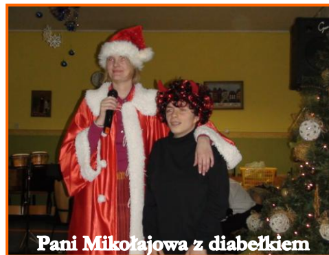
Pani Mikołajowa z diabełkiem