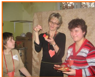
Rozdanie upieczonych serduszek

połówki. Niespodziankę również przygotowała sekcja życia wręczając wszystkim upieczone serduszka. Po konkursie sekcja gospodarcza zaprosiła wszystkich na pyszne ciasto i kawę. projekcja filmu "Nigdy w życiu". Po filmie odbyła się dyskoteka. Ten dzień wszyscy spędzili w milej atmosferze.