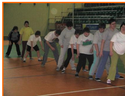
Konkurencja z piłką lekarską

W lutym w Elblągu otwarto halę widowiskowo - sportową. Warsztat Terapii Zajęciowej zorganizował tam jedne z pierwszych zawodów sportowych, w których udział wzięli uczestnicy z : WTZ Beniowskiego, WTZ Saperów, WTZ WOK, oraz wychowankowie z Młodzieżowego Ośrodka Wychowawczego z Kamiennicy Elbląskiej. Panowie wzięli udział w rozgrywkach piłki halowej natomiast panie rywalizowały w konkurencjach z piłką lekarską. Pierwsze miejsce w piłce halowej zajął Młodzieżowy Ośrodek Wychowawczy, My zajęliśmy drugie miejsce.