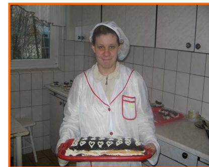
Ciasto na walentynki