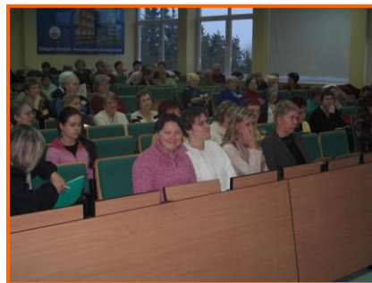
Oczekiwania na ogłoszenie wyników