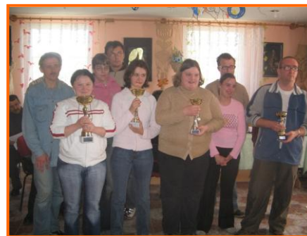
Zdjęcia grupowe wszystkich drużyn